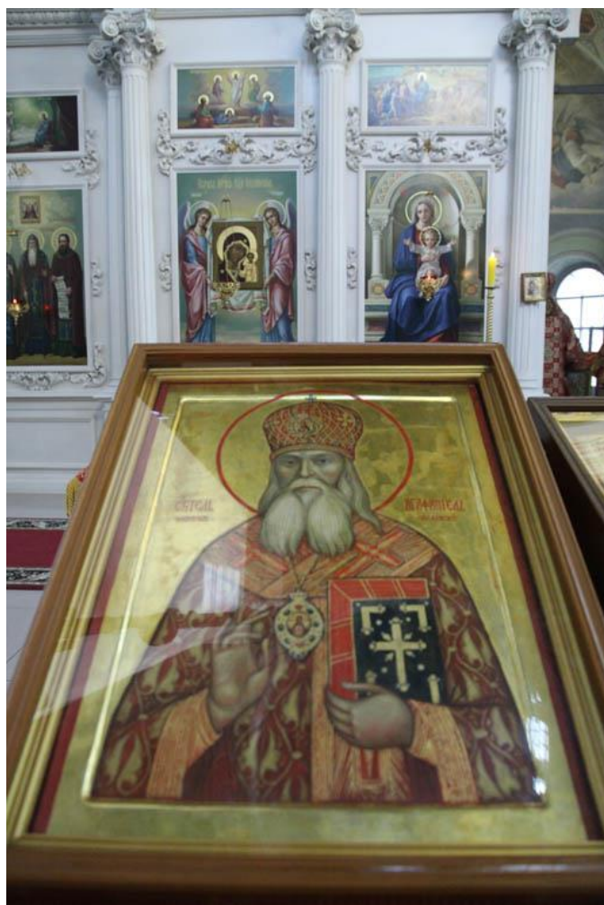
Рис.4.10 – Икона священноисповедника Агафангела митрополита Ярославского и Ростовского в Ярославском Казанском соборе