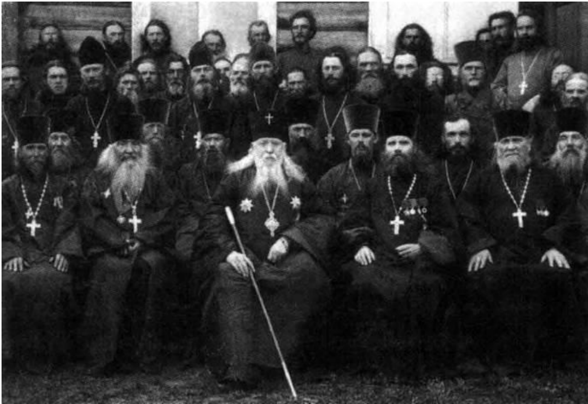
Рис.4.7- Митрополит Агафангел с группой духовенства.