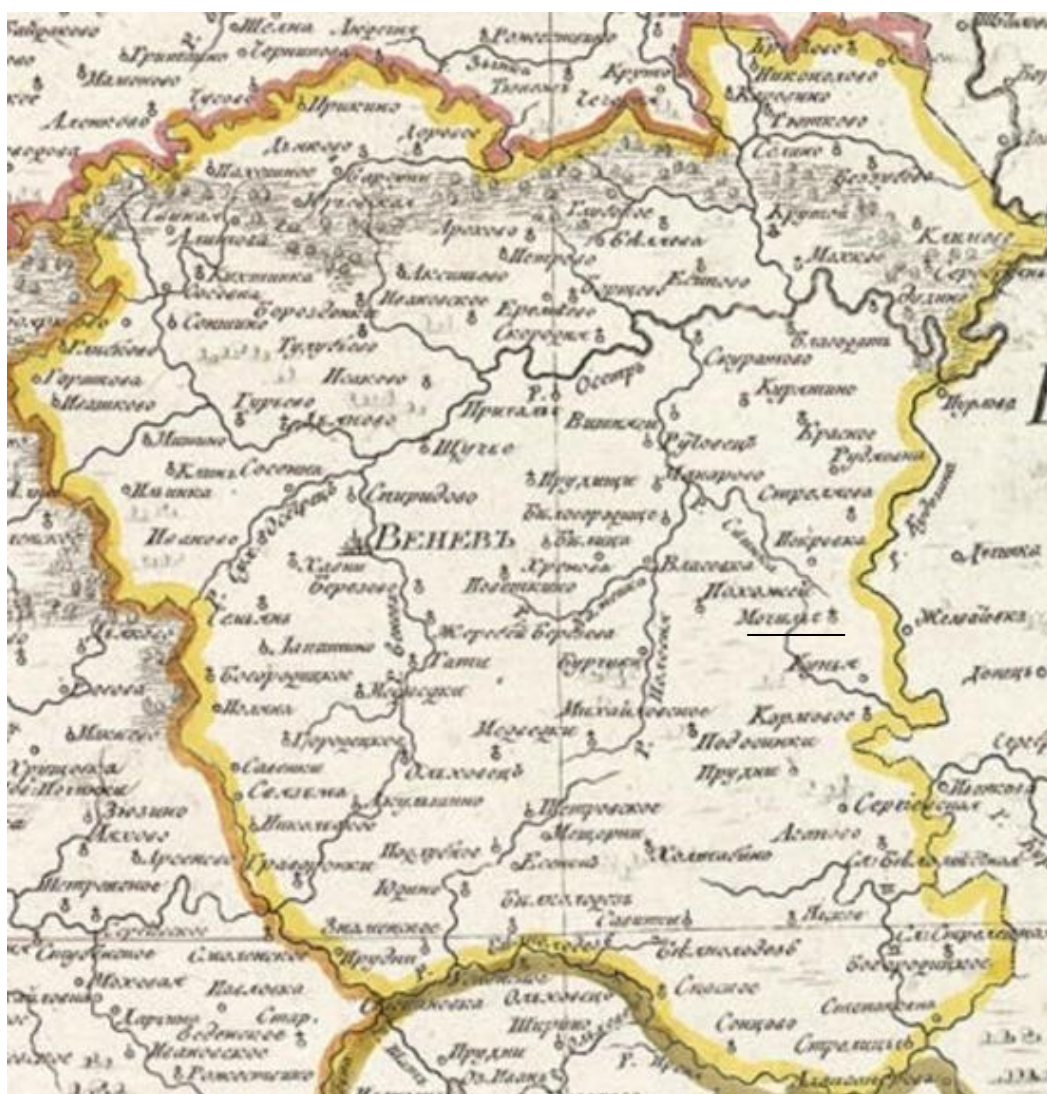
Рис.1.1 – Карта Веневского уезда 1800г. с обозначение села Мочилы