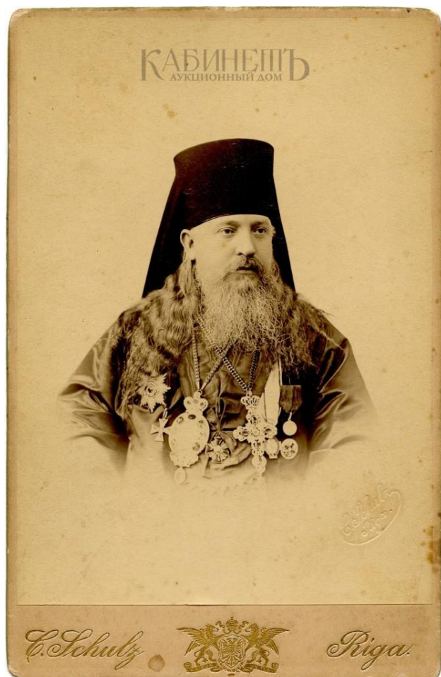
Рис. 4.3 - Фотография архиепископа Рижского и Митавского Агафангела (Преображенского) начало 1900-х гг.