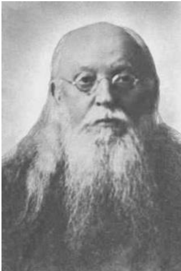
Рис.4.8 - Митрополит Агафангел (Преображенский), ярославская тюрьма, 1922 год 135 .