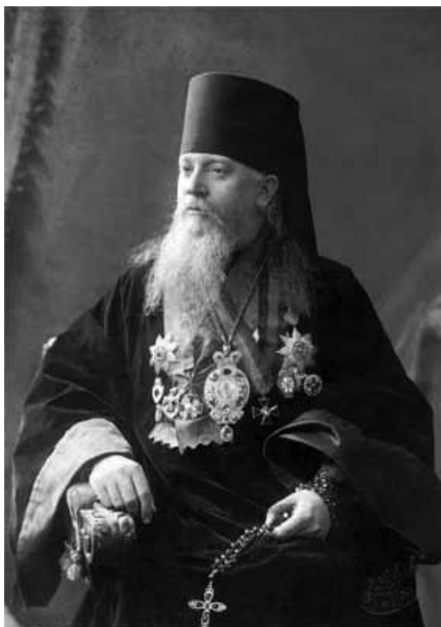
Рис. 4.4 - Фотография архиепископа Литовского и Виленского Агафангела (Преображенского), 1910 г.