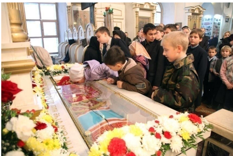
Рис.4.11 - Рака с мощами священноисповедника Агафангела (Преображенского) в Казанском Соборе г.Ярославля.