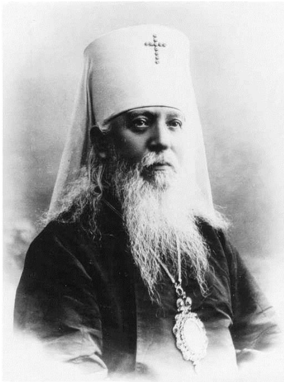
Рис. 4.5 - Фотография митрополита Ярославского и Ростовского Агафангела (Преображенского), 1915г.