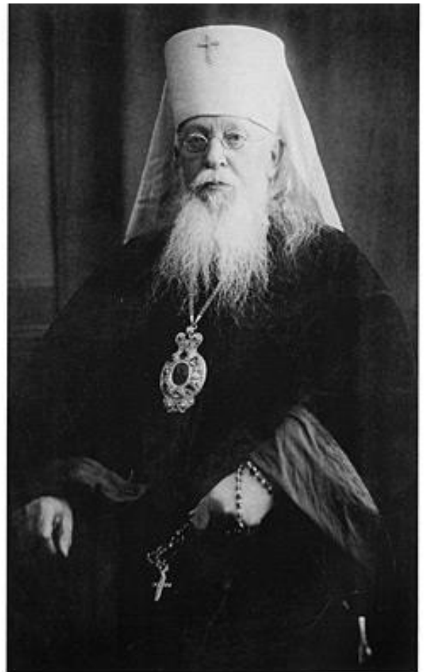
Рис. 4.6 - Фотография митрополита Ярославского и Ростовского Агафангела (Преображенского), 1918-1920гг.