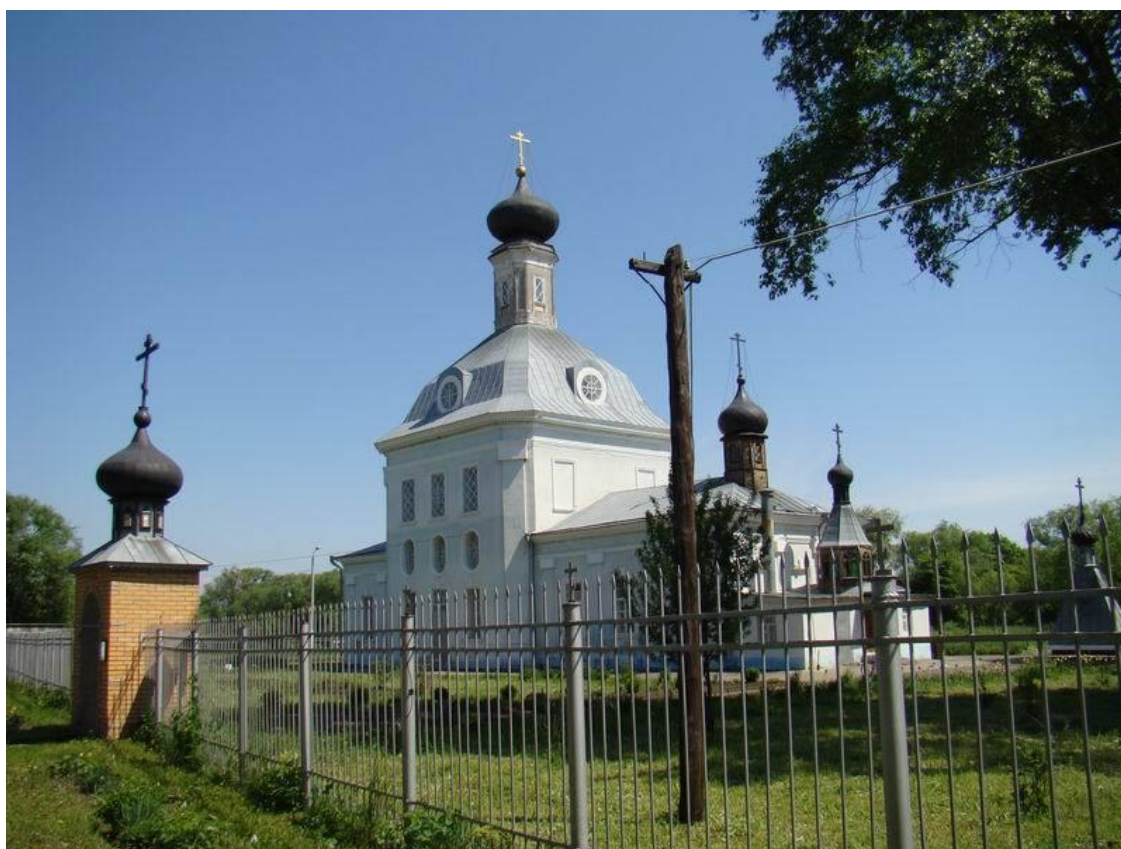
Рис. 3.2 - Храм Рождества Христова села Мочилы в настоящее время