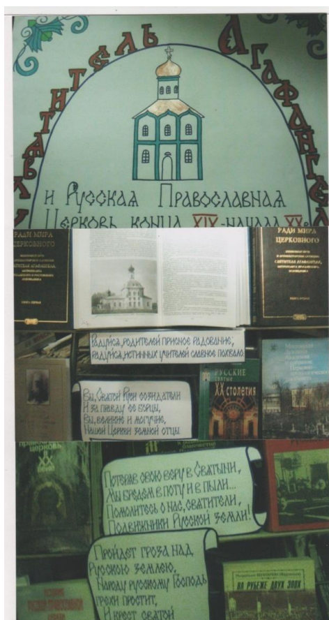
Рис.3.6 - Агафангеловские чтения