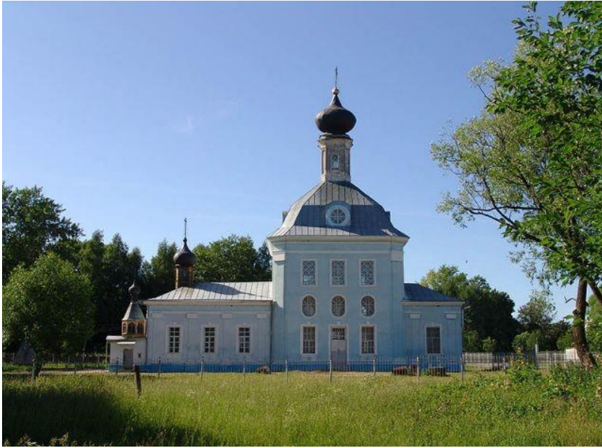
Рис. 3.3 - Христорождественский храм села Мочилы, где прошло детство святителя Агафангела митрополита Ярославского и Ростовского