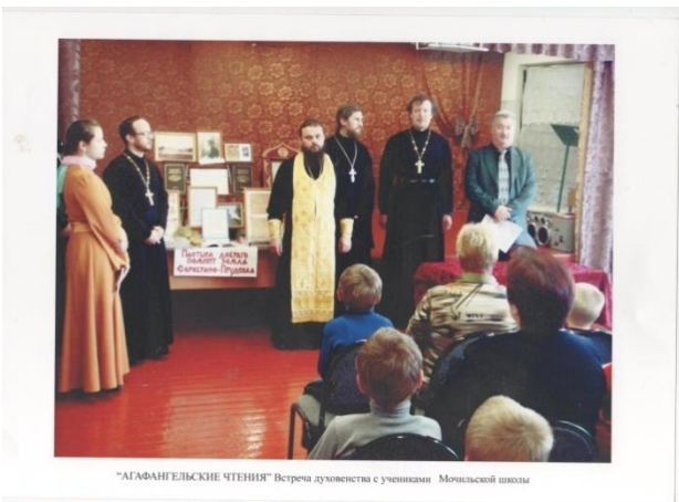
"АГАФАНГЕЛЬСКИЕ ЧТЕНИЯ" Встреча духовенства с учащимися Мочильской школы